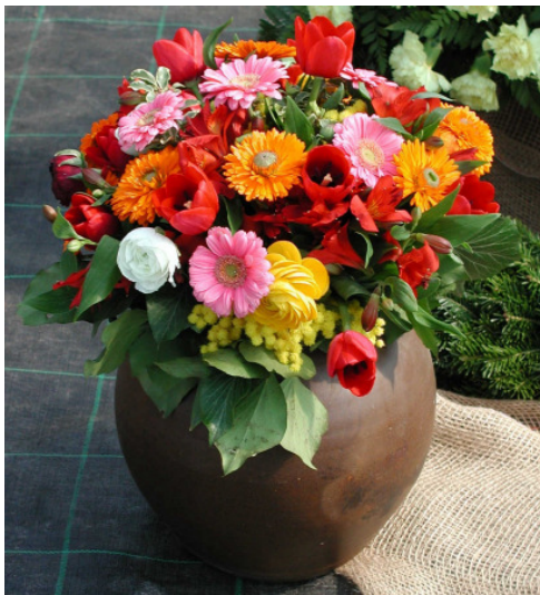
Melodien: „O. Du schöner Mai“